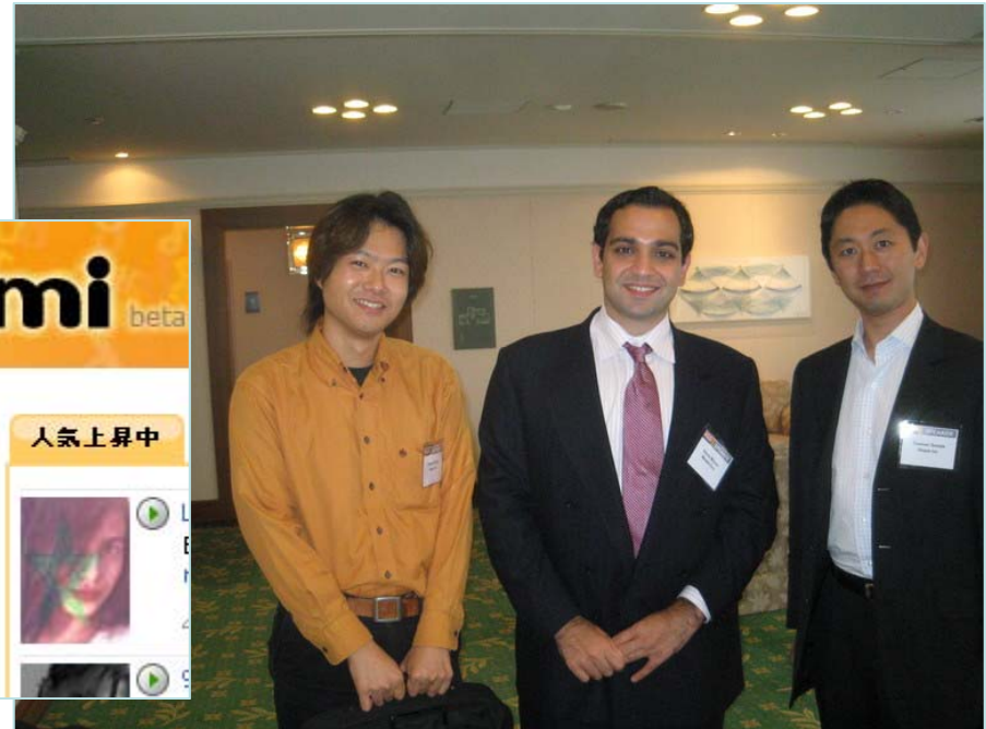
首藤, Keyvan, 園田 Red Herring Japan 2007, 京都, 2007年 7月