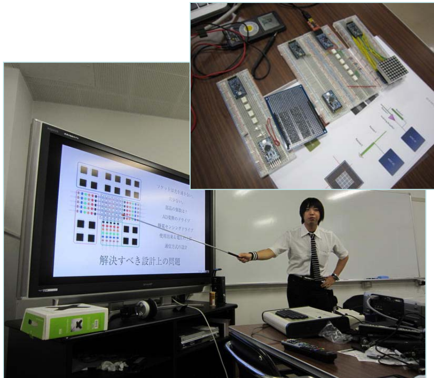
落合プロジェクト