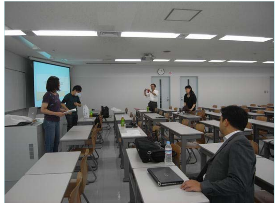
片山プロジェクト @工学院大