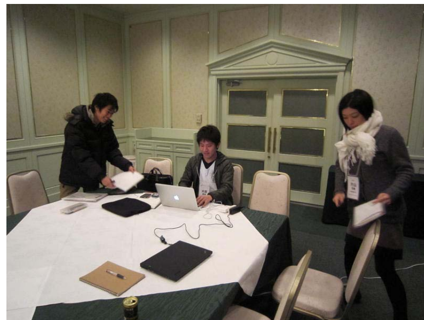
片山プロジェクト @箱根 (学会の会場)